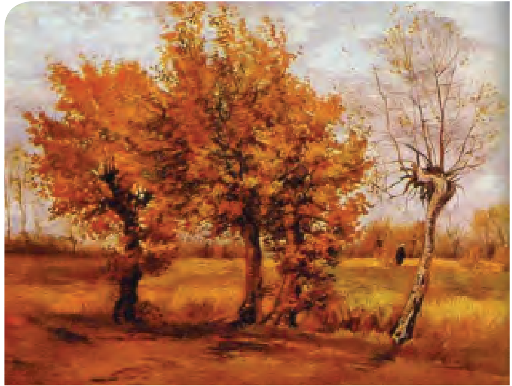
«Φθινοπωρινό τοπίο με τέσσερα δέντρα»